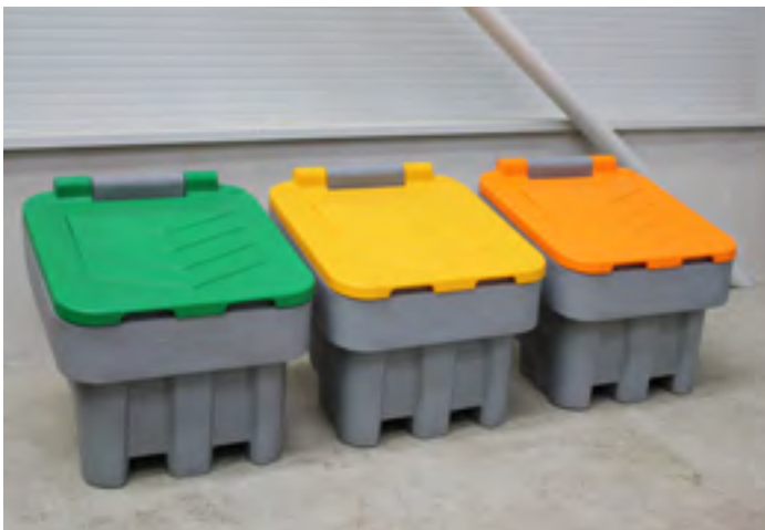
ARROW 400 různé farby veka